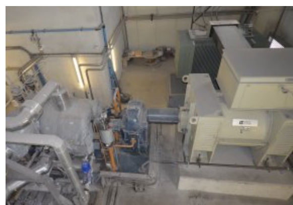
La turbine à vapeur et son générateur Leroy Somer