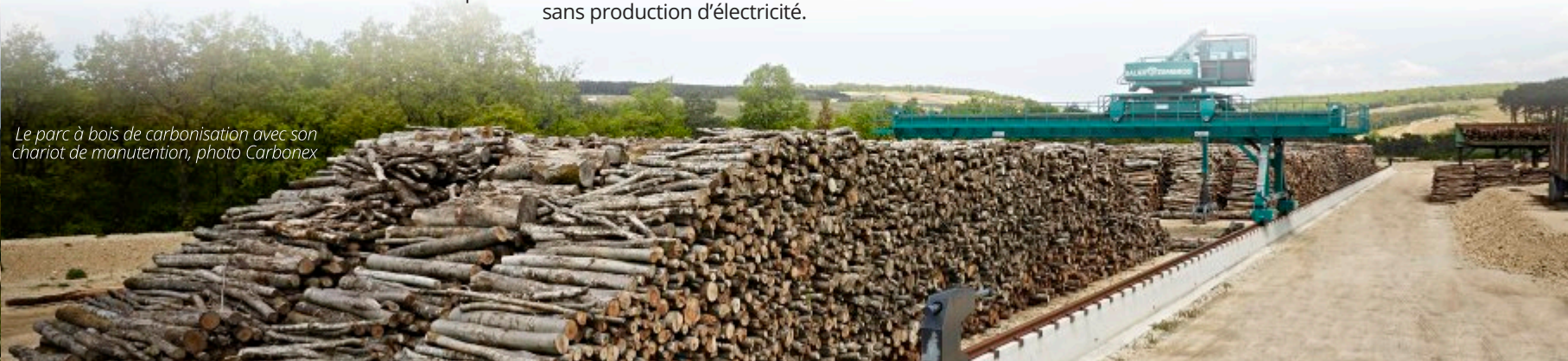
Le parc à bois de carbonisation avec son chariot de manutention