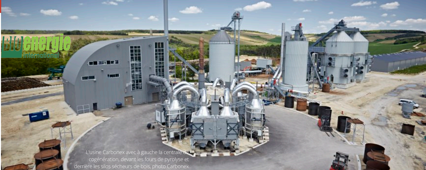
L'usine Carbonex avec à gauche la centrale de cogénération, devant les fours de pyrolyse et derrière les silos sécheurs de bois