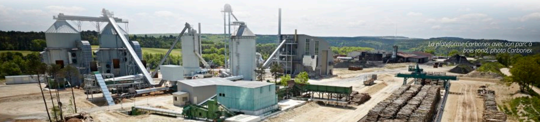
La plateforme Carbonex avec son parc à bois rond

Cependant, quelques années plus tard le contexte économique se complique face à l'offre des pays à bas coût de main d'œuvre, à bas coût de bois, sans normes environnementales, mais