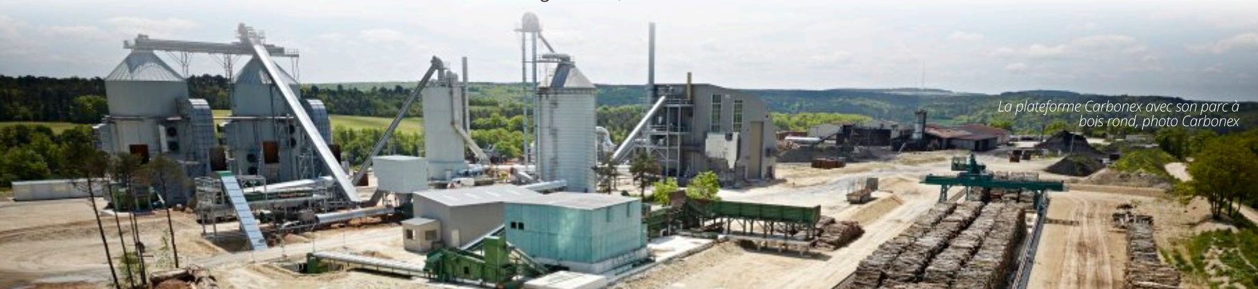
La plateforme Carbonex avec son parc à bois rond, photo Carbonex

Cependant, quelques années plus tard le contexte économique se complique face à l'offre des pays à bas coût de main d'œuvre, à bas coût de bois, sans normes environnementales, mais