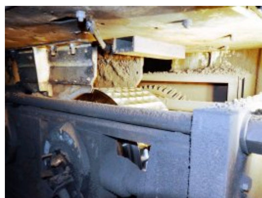
Presse à roue tangente dite à boulets pour valoriser les fines de charbon de bois

innovants, l'entreprise a pu relocaliser sa carbonisation en France, produire selon des critères environnementaux européens et valoriser une ressource véritablement locale. La diversification des productions de son côté, avec en particulier par la production d'électricité participe aujourd'hui à près de 30% des recettes de l'entreprise. En 2015, celle-ci a réalisé en France un chiffre d'affaire de 14 millions € et a employé 45 personnes dont une dizaine en R&D.