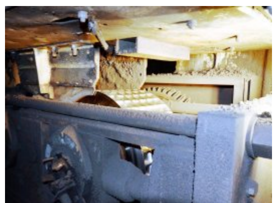
Presse à roue tangente dite à boulets pour valoriser les fines de charbon de bois

innovants, l'entreprise a pu relocaliser sa carbonisation en France, produire selon des critères environnementaux européens et valoriser une ressource véritablement locale. La diversification des productions de son côté, avec en particulier par la production d'électricité participe aujourd'hui à près de 30% des recettes de l'entreprise. En 2015, celle-ci a réalisé en France un chiffre d'affaire de 14 millions € et a employé 45 personnes dont une dizaine en R&D.